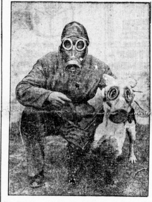
Ein Arbeiter und sein Gesellschaften mit Gasmasken.