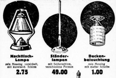
Nachtlampe rein Messing vernickelt, mit kunstseid. Schirm 2.75 Ständerlampe mit Söldenschirm, verschiedene Formen 49.00 Deckenbeleuchtung rein Messing mit matter Scheibe 1.00