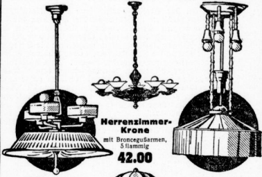
Schirmkrone vernickelt, mit Wiener kunstseid. Schirm, Blende ca 70 cm 29.00 Herrenzimmerkrone mit Bronzegehäusen, 5flammig 42.00 Zugkrone rein Messing, mit ca. 60 cm kunstseid. Schirm 12.00