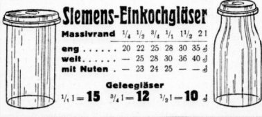
Gummiringe Stück 3 4 5 3.90 Einkoch-Apparate im Vollbade verziert, mit Thermometer und Klammern. Rekordpreis nur 3.90 Klammern Stück 4 5 3.90 Stiemens-Einkochgläser Massivrand 1/4 1/2 3/4 1 1 1/2 2 1 eng . . . . . 20 22 25 28 30 35 40 weit . . . . . 25 28 30 36 40 mit Nuten . . . . . 23 24 25 . . . . . Geleeggläser 1/2 l = 15 3/4 l = 12 1 1/2 l = 10

Jetzt ist Hochbetrieb bei uns im III. Stock.