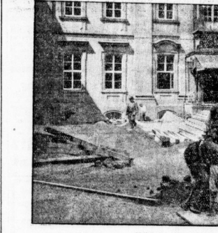
Bild in den Hof des Reichspräsidenten-Palais, die jetzt umgebaut wird.