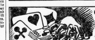
16. Fortsetzung. Die Kunst des Weissenfels, Treppe, Auszug und Weissenfels.