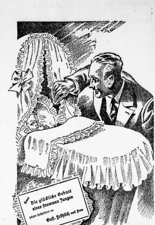
Die glückliche Geburt eines starken Jungen

Ein frohes Ereignis Ein Junge ist da - wiegt ganze 7 Pfund - ein wahrer Prachtkind! Da schläft er in seinem Wiegenbettchen - in einem blütenweißem Linnen. Alles atmet Frische und Sauberkeit! Ja, Persil hat seine Pflicht getan. Auch später wäscht es Babys niedliche Sachen, sooft es sein muß, immer wieder schonend rein. Und alles wird durch das gute Persil zuverlässig desinfiziert.