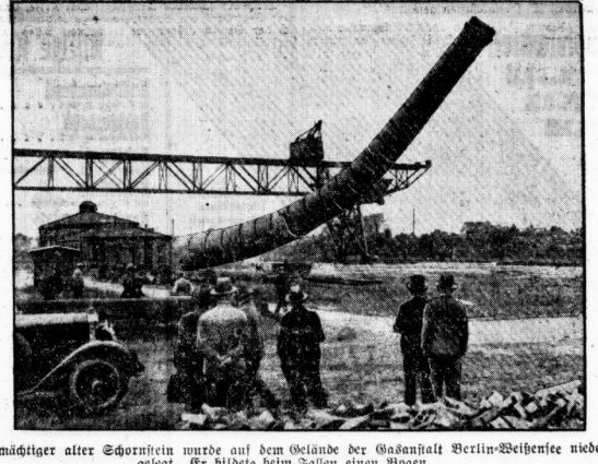
Ein mächtiger alter Eisernturm wurde auf dem Gelände der Gasanstalt Berlin-Weißensee niedergelegt.