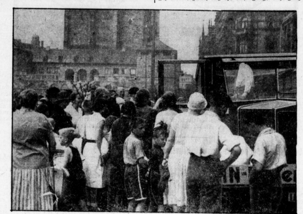
Freier Empfang am dem Stadmarkt.