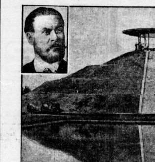
Das Denkmal für den Seefahrtspionier Lillenthal vor der Vollendung. Im Hintergrund ist die große Angel hinaufgeführt, die den Wunden zuzuführen wird.