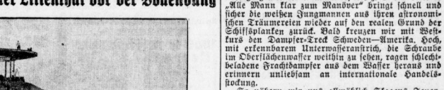
Das Denkmal für den Seefahrtspionier Lillenthal vor der Vollendung. Im Hintergrund ist die große Angel hinaufgeführt, die den Wunden zuzuführen wird.