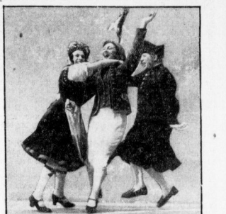
Schöne altbekannte Trachten mit Hochzeitsfeier.

Was der Mann bis zum Sommer das war das Motto der altdeutschen Trachtenfabriken, die gestern nachmittag im Garten der Seidenweberei