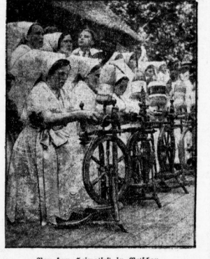
Von dem Heimatfest in Weiskau.