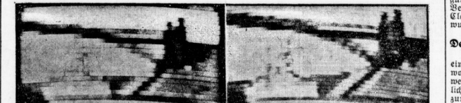
Die Qualität des Fernseh-Bildes hängt von der Funkstrahlung ab. Die vier Bilder, die mit hier zeigen, sind sämtlich von einer Vorlage (ein Kreuzer im Reiter-Schiffen-Banal) durch Fernseh-Übertragung übertragen worden...