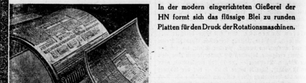
In der modern eingerichteten Gießerei der HN formt sich das flüssige Blei zu runden Platten für den Druck der Rotationsmaschinen.