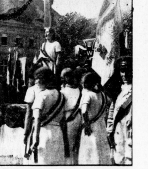
Die neue Fahne des hallischen Vereins wird geweiht.