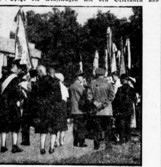
Eröffnung für die Gefreiten des Regiments.