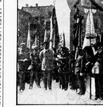
Die neue Fahne des hallischen Vereins wird geweiht.