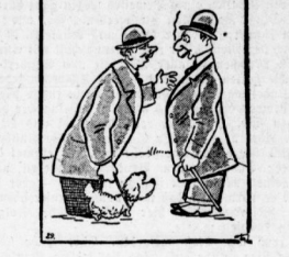
„Sie sagen, daß es ein Polizeihund ist, er steht aber eher aus wie ein Hund.“