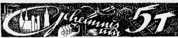
Ein Heimatroman von Arthur Petsch