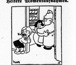
„Mama! Mama! In der Küche ist ein Schupmann, er verhaftet die Köchin!“