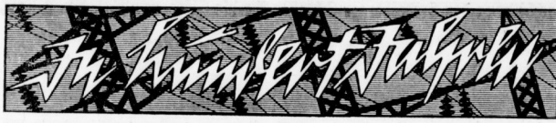
Die künftige Energie-Versorgung der Welt / Von Hanns Günther (W. de Haas)

7. Fortsetzung Nachdruck verboten - Copyright 1931 by Franck'sche Verlagshandlung, Stuttgart