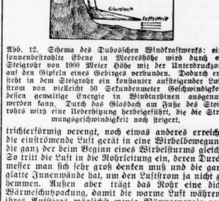
Abb. 12. Schema des Duboschen Windkraftwerks: eine fadenförmige Ebene in Meereshöhe...