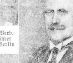
Provinzial-Verb. Geschäftsführer Freising, Berlin