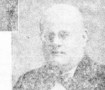
Gem.-Vorl. Weiseng Lauthammer