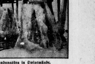
Die Kälte hält an — Die Folgen des Winterwetters

Der Schiffverkehr auf der Unterelbe bietet bislang nur für Motorisierte Schwierigkeiten, größere Dampfer verkehren unbehindert. Einige kleinere Passagierschiffe zwischen Berlin und Unterelbe sind durch das Eis festgehalten. Die Ursache des Brandes ist noch nicht bekannt. Die Besatzung wurde gerettet. Die Ursache des Brandes ist noch nicht bekannt. Die Besatzung wurde gerettet.