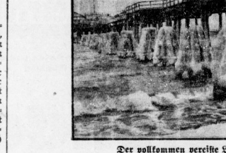
Der vollkommen vereiste Kondensator im Zwickmühle.