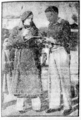
Die bekannte deutsche Filmschauspielerin Marlene Dietrich gibt ihren Neuen Namen bekannt.