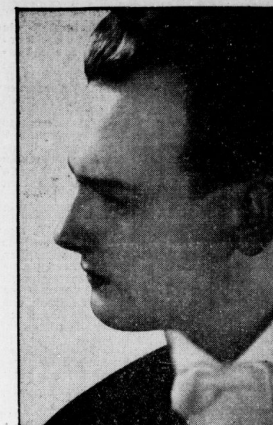
Im Rahmen der Jahrhundertfeier der Roberts Franz-Zing-Akademie gibt Sein Wartzen am Freitag...