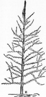
Stachelbeere in Spindelform.

Und noch aus einem anderen Grunde, als schon angegeben, ist die Spindelform profitabel und nützlich. Der leere Raum unter dem Erdboden steht meistens zur Verfügung. Wir sollten lernen, ihm zu anderen Zwecken besser auszunutzen. Das kann durch die empfindliche Stachelbeerspindel geschehen. Solche Bäume in Manneshöhe sind über und über mit schönen großen Früchten behangen. Besonders dem Hausgartenbesitzer und Schrebergärtner sollten diese Anregungen Veranlassung sein. Stachelbeeren als Spindel zu ziehen, weil kein Raum beschränkt ist und die breitwuchernden Straucher im Hausgarten entstehen und andere Kulturen beeinträchtigen. Gartenbauinspektor K.