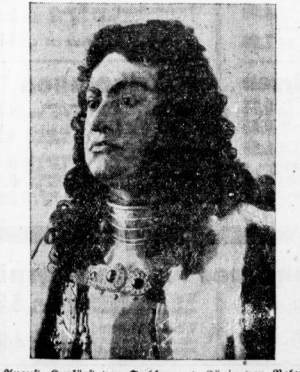
August, Kurprinz von Sachsen und König von Polen.

Wissenschaftlich ist der Feldherrnruhm dieser Stempels. Er kämpft, kurzlich schon, als kaiserlicher Generallieutenant gegen die Türken in Ungarn. Sein Wut wird gelobt. Aber die Schlachten bei Prinz Eugen