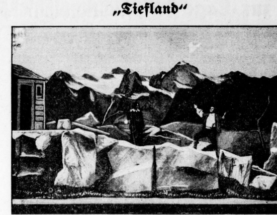
Bühnenbild aus dem Schauspiel von Peter Krause / Sgl. das Heulleton dieser Kammer. phot. Peter Krause.

Zum Vergleich mit den Angaben der Wetterkarte sind für Halle die 10,0 mm barometrischen.