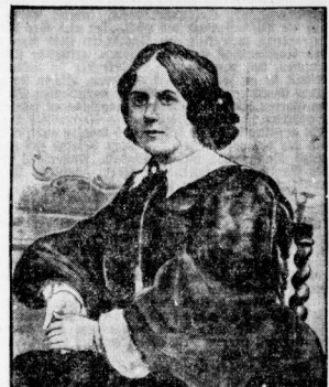
Minna Wagner, geborene Planer die erste Gattin Richard Wagners

Richard Wagner, geborene Planer die erste Gattin Richard Wagners