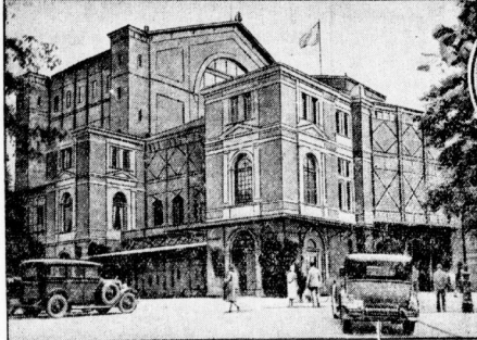
Das Festspielhaus in Bayreuth

Nach dieser Dämpfung wendet er sich leidenschaftlich ab; die Nachstehenden leben, wie ihm die Tränen über die Wangen rinnen ... Begreifungsgrüßen in Bayreuth - und schneile