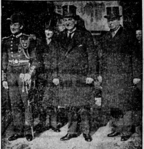
Das Schiff 'Deutschland' hat gestern morgen Kiel verlassen, um zur Indienstellung nach Wilhelmshaven zu fahren...