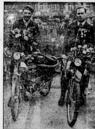
Sibiria-Expedition auf dem Fährort... Sibiria-Expedition auf dem Fährort

Der Festtag der Reichsmarine... Der Festtag der Reichsmarine