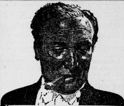
Hans Albers der Held des Tages In seinem neuesten und letzten Groß-Film dieser Saison