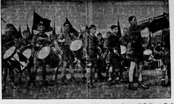
Die Trommelhosen bei dem großen Aufmarsch der Hitlerjugend im Brunnenfeld-Platz zu Berlin