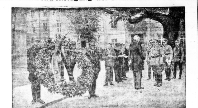
Die Begrüßung des Ministerpräsidenten Göring (X) durch den Oberbürgermeister von Potsdam, Rauscher (XX) an der berühmten Birschentischlinie...