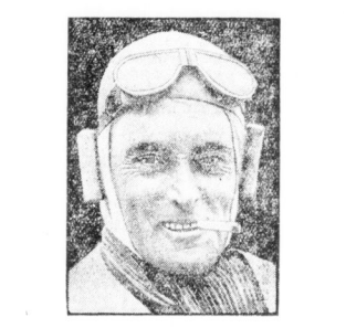
Sir Malcolm Campbell