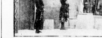
Hebbels „Nibelungen“. — Siegfried betritt König Gunthers Halle. — Bühnenbild von Peter Krausen. (Vergleiche das Feuilleton dieser Nummer.)