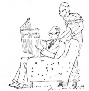
Und ein treuer Wegweiser: der HN-Anzeigenteil.

Ich bin glücklicherweise vier Wochen etwas älter als das Ehepaar. Ich habe ein Haus, das ich zu kaufen möchte. In der Regel ist es ein Haus, das der Käufer zu kaufen wünscht, und es ist ein Haus, das der Käufer zu kaufen wünscht. In der Regel ist es ein Haus, das der Käufer zu kaufen wünscht, und es ist ein Haus, das der Käufer zu kaufen wünscht.