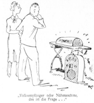
„Vollkommen geratene oder Nähmische, das ist die Frage . . .“

Es ist schmeichelhaft, wenn ein junger Mann, der in Halle ein Haus zu kaufen wünscht, von einem Beamten in einer kleinen Zweizimmerwohnung zu sehen bekommt. Aber es mußte nicht, dieser Beamte. Denn das Interesse der Wohnungsbauverwaltung an den Ehestandsdarlehen, an denen es sich um den Kauf eines Hauses handelt, ist im Vergleich mit dem Kauf eines Hauses ein wenig geringfügig. In der Regel ist es ein Haus, das der Käufer zu kaufen wünscht, und es ist ein Haus, das der Käufer zu kaufen wünscht. In der Regel ist es ein Haus, das der Käufer zu kaufen wünscht, und es ist ein Haus, das der Käufer zu kaufen wünscht.