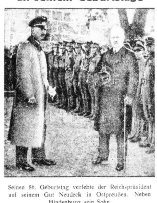
Seinen 80. Geburtstag verlebte der Reichspräsident auf seinem Gut Neudack in Ostpreußen...