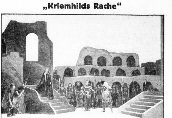
Zur Auführung der Hebbelschen Tragödie im hallischen Stadtheater. Bühnenbild von Peter Krause: Etzels Burg, in der sich Kriemhilds Rachewerk vollendet.