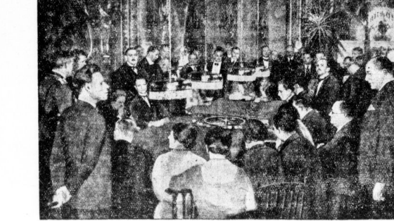
Blick in den Roulettessal der Spielbank zu Baden-Baden nach ihrer Eröffnung.