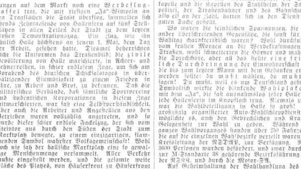
Die letzten Informationen zur Wahl