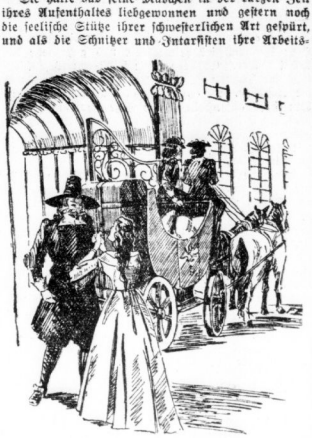
„Acht, nur fort!“ sagte Beatriz gepöbelt.