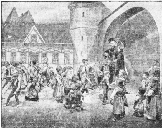
Dieses niedliche Puppenbild ist auf der Sommerer Spielzeugschau zu sehen, die im Rahmen der großen Weihnachtsmarktausstellung in Berlin veranstaltet wird