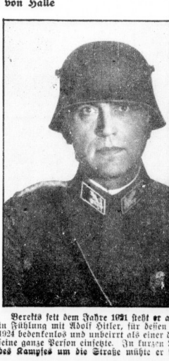
Bereits seit dem Jahre 1921 steht er als Kämpfer...