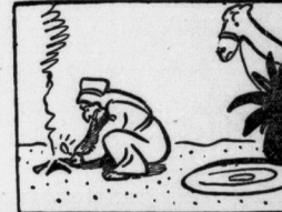
Vom Trunk erfrischt er Feuer macht. Will haben kann, als dies vollbracht.