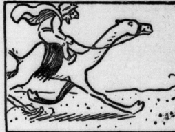
Und dank des klugen Tieres Rafe kommt er zum Zümpel der Oase.