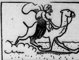
Ein Beihime durcheinander auf dem Kamel den Sand durdloht.