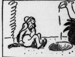
Doch findet er kein Wasser mehr. Denn das Kamel ist all leer.