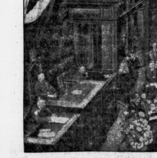
Bild in das Reichsliche Herrenhaus während der NSDAP, die über die Aufgaben der Reichsministerien im Rahmen der nationalsozialistischen Bewegung sprach.