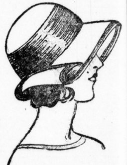
Eleganter schicker Damenhut aus Crépé maroquin Reklamepreis 8.50