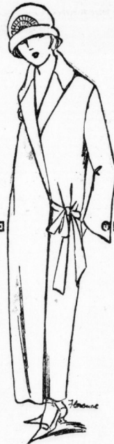
Frühjahrs-Mantel moderne Blindeform, Covercoatfarbig 17.50

Alpacca-Unterröcke 4.90 mit Volant, weit geschnitten