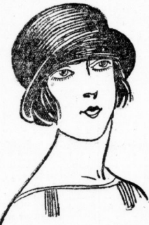
Kleine fesche Hutform echt Liseré Reklamepreis 3.95