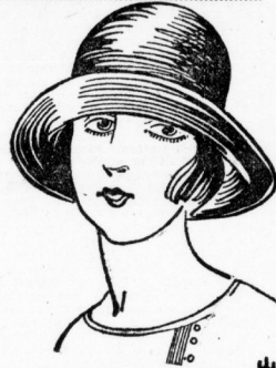
Kleidsame neuartig aufgeschlagene Form echt Liseré Reklamepreis 4.80