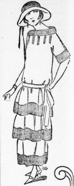
Fesches Kleid weiss Voll-Voile mit farbigem Volant, Aermel u. Kragen-Garn. 22.50

Um die Anschaffung guter Damen-Konfektion und moderner Damen-Hüte möglich zu machen, bringen wir mit diesem