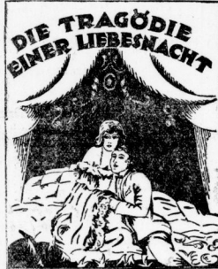
Ein Sittenabenteuer in 6 Akten von Jack Mylong.

11 Ab heute Donnerstag! 11 Kolossal-Akte! Unser grösster Treffer Kolossal-Akte! ist das soeben fertiggestellte Sitten-Großstadt-Gemälde