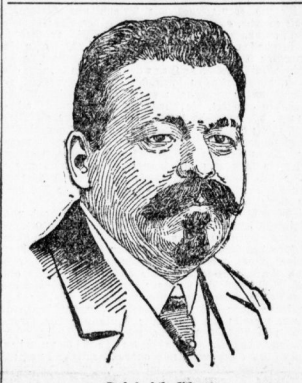
Friedrich Ebert zur Zeit seines Antikritik der Reichspräsidentenwahl.

einer einzigen Partei. Ich befürchte aber auch, daß ich ein Sohn des Arbeiterbundes bin, aufgewachsen in