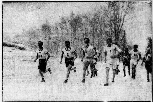
Im Schneegeflüster durch die Öblauer Heide. Seniorenklasse beim Frühjahrslauf der Hallischen Turnerschaft.