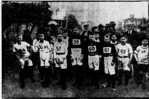
Waldbau der Hallischen Turnerschaft. Die Knaben am Start.

Zielfahrt, Zuverlässigkeitsfahrt mit Platz- und Geschwindigkeit und Winterrennen, an die sich vom 4. bis 6. August die ebenfalls schon erwähnte Bad Harseburg Autoportivowoche mit einem Automobilturnier, Zielfahrt, Zuverlässigkeitsfahrt, Platz- und Geschwindigkeit anschließt, die der Braunschweiger M. C. gemeinsam zur Durchführung bringen. Vom 12. bis 13. September steht eine Zuverlässigkeitsfahrt mit Platz- und Geschwindigkeit auf dem Programm des Hannoverischen M. C. Das Hainbergrennen am Anstöße des Harnes bei Göttingen ist für den 3. Mai angesetzt, während im Juni zum fünften Male die Hallische Fahrt durch die Heisterberge vom Start gelassen wird. Hieran schließt sich dann die für den Herbst geplante Postfahrt für Ratten und Räder. Den Schluß für die Motorräder dürfte dann die Darmstädterfahrt bilden.