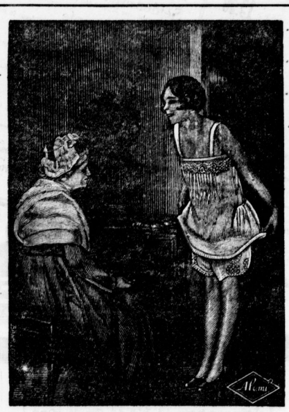
Ja, liebes Grossmütterchen; Heut trägt man nur noch Alemi-Wäsche.