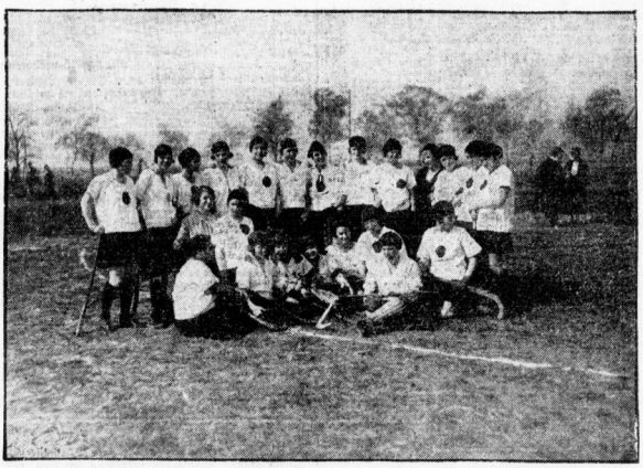
Damen-Hockey-Club Halle gemeinsam mit dem Danziger Damen-Hockey-Club. Aufnahme vom Hohen-Reformatoren des 2. 9. 99. Wertheim. Halle gewann den Pokal durch 2 Siege von 6:0 über Naumburg und Danzig.