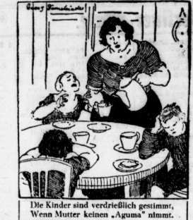
Die Kinder sind verdrießlich gestimmt, Wenn Mutter keinen 'Aquama' nimmt.