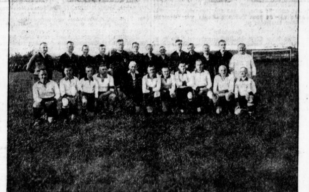
In dem Künftig auf dem Sonntag am 200 stattgefundenen Fußball-Wettbewerb teilnahmen die Spieler der VfL Eintracht Frankfurt, des Saalegaues (hinten) dem Saalegauborward mit 7:2.

Das Ziel beendet sich für alle Staffeln nicht am Rebeedplatz in der Zielstraße. Die Läufer haben Aufgabe, eine Uhrprobe von Mann zu Mann zu befahren. Jeder Läufer darf zum Überbringen der Nachricht nur einmal herumgehen und trägt dabei eine Startnummer. Die Uhrprobe hat immer von einer niedrigeren an eine höhere Nummer zu erfolgen, wobei bei Ausfällen eine Nummer gefaltet ist. Dieser letzten Fall wird sich niemand wünschen, denn durch das Ausfallen der doppelten Strecke wird die betreffende