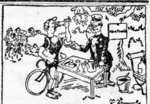
Ein Mann fährt ein Fahrrad.