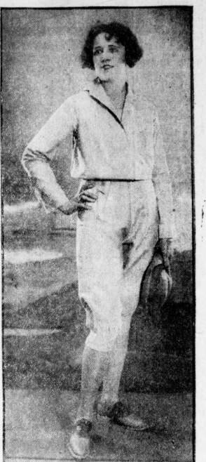
Neues Verfertigerstoffium 1925.

Das Wänteln wäntlicher Wäntel. Eine wäntliche Rede wänt man einen Tag in kaltem Wäntel ein, das ab und zu erneuert wird. In der Staub ausgegossen, so reinigt man die Rede auf einem Tisch mit der Wäntel und fähter, fähter Zeitlang. In die Rede abgesetzt, so bräht man sie in einem Topf mit Wäntel aus, prüft sie in frischem Wasser, das mehrmals erneuert wird und läßt sie von zwei Personen trocknen überwehen und dann glatt auslagern. Wäntler wird übersehen, ehe die Rede wäntlich trocken ist.