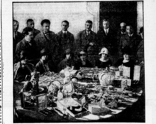
Der Kronprinz der Romanos.

Das größte dänische Handelsunternehmen ist die „Cesafantist Kompani“ („Cesafantist Kompani“), die Handel mit Ozean betreibt. Vor einiger Zeit hat, wie in der dänischen Presse zu lesen ist, die