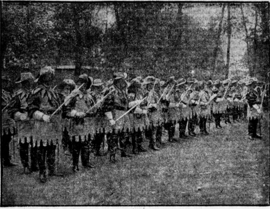
Ritterfahrt der Panzgrafien nach Febrbeklin.