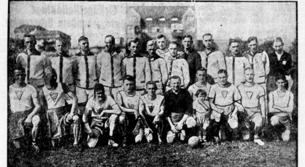
Der Deutsche Handballmeister, P. E. Berlin, im Vordergrund, mit 13:2 gegen die Schweizer.

Turner-Handball. Am Sonntag ist der Handballwettkampf zwischen der Halle'schen Turnerzeitung und der Turnerzeitung der Stadt Halle. Die Halle'sche Turnerzeitung wird ihren Gegner in der Halle im Stadion schlagen.