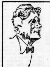
Hermann Picha als: Photograph