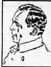
Fischer-Köppe als: Chauffeur Franz