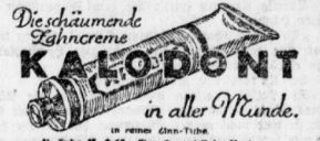
Die schäumende Zahngreife KALODONT in aller Munde.