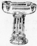
Stahlplatte 83 cm hoch 19.75