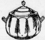
Schale edel Weßling 29.-