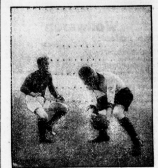
Eine spannende Kampagne.

In Saalgaun gab es ein feines Spiel zwischen 1910 und 2010. Nachdem nach dem ersten