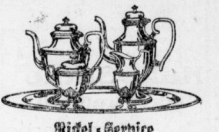
Ridel-Gerbice für Kaffee u. Tee, schmere Qual. 54.- als Kaffee-Gerbice, schmere Qual. 27.-