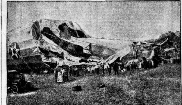
Die Fahrer der für sich benutzten 'Sphenobach'. Das Bild ist die erste Aufnahme nach der Besteigung des Luffschiffs.