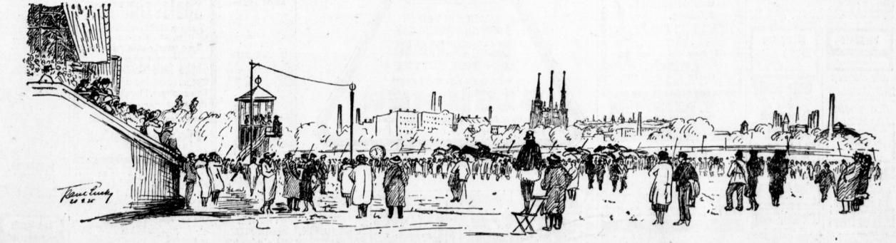
Die Rennbahn zu Halle, die „schönste Rennbahn Mitteldeutschlands.“ Ansicht des Stadtplatzes rechts der Tribüne. — Im Hintergrund die Stadt Halle mit den fünf Türmen.