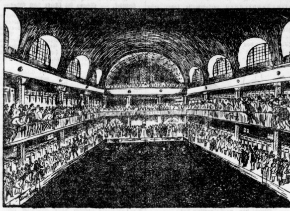
Wettchwimmen im Stadbad. In der von Zuschauern dichtbesetzten Schwimmhalle des Stadbades wurden gestern unter glänzender Leitung die Wettchwimmungen des 23. 9. abgetragen.