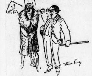
Einer der „vorbeigehtip“ hat.