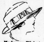
Moderner Filzhut 8.90