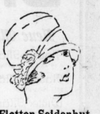
Flotter Seldenhut 3.75