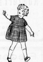
Babykleidchen lt. Bild, aus schön. Schottenstoffen, mit Knopfgarnitur 2.95