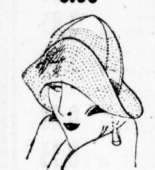
Fescher Samthut 9.50