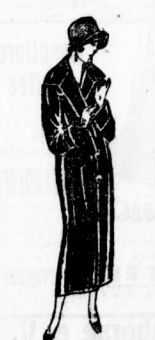
Sealplüsch-Mantel lt. Bild, in Qualität, ganz auf Frottee 65.00