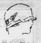
Kleiner Filzhut 2.90