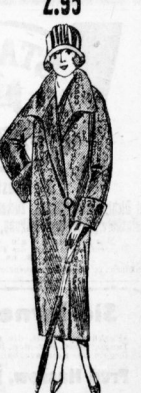
Damen-Mantel lt. Bild, aus guten pelierten Wollstoffen 9.50