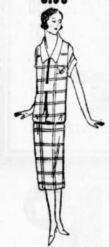
Modernes Schottenkleid lt. Bild, mit weißem Bsp. kragen, Aermelaufschlag, Seidenrüsche, Leckgürtel 5.95