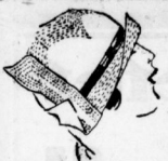
Schicker Samthut 6.90