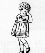
Babykleidchen lt. Bild, aus kunst. Trikot, m. Stickerl, sehr kleidsam 5.50