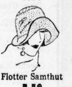
Flotter Samthut 7.50