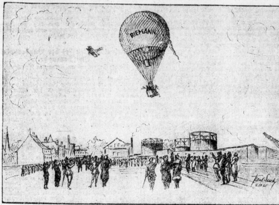
Mitteldeutscher Stahlhelm-Sporting. Start zur Freiathlon-Geschick auf dem Gelände der höchsten Gasanstalt.

Aus diesem Trübel eigener Vorbereitungen heraus führt uns das Auto zum halbfischen Flugplatz, wo drei Flugzeuge — die halbfische „Rode-Wulf“, ein Dietrich-Gobiet und der „Merseburger Mobe“ — zum Start für die mitteldeutsche Stahlhelm-Staffel, welche über Hohenburg-Lehzig-Merseburg fährt, bereitstehen. Der Start verzögert sich des frühen Morgennebels wegen. Dann aber brechen die drei Maschinen in das weißgraue Licht des Morgenhimmels